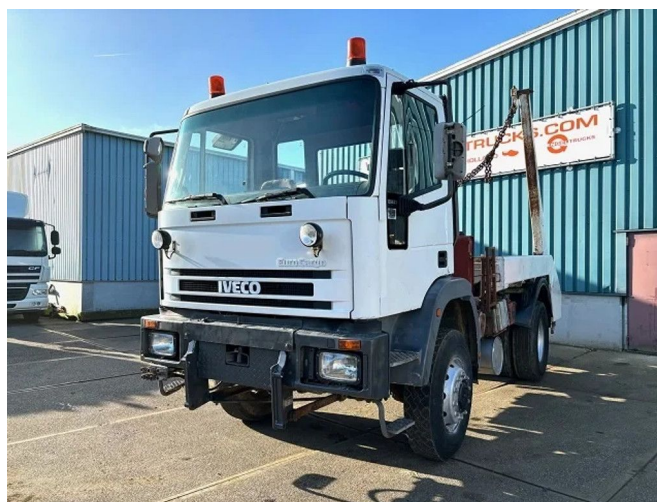
Iveco Eurocargo 135E23WR 4x4 FULL STEEL PORTAL CON... Referentienummer: SN 56213162