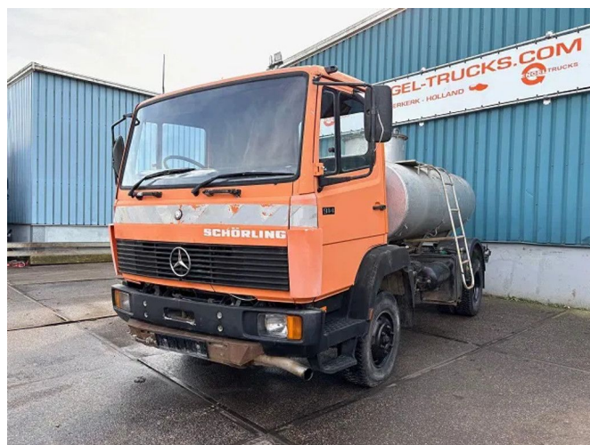
Mercedes-Benz LK 914KO RHD 4x2 FULL STEEL TANK TR... Referentienummer: SN 57816153