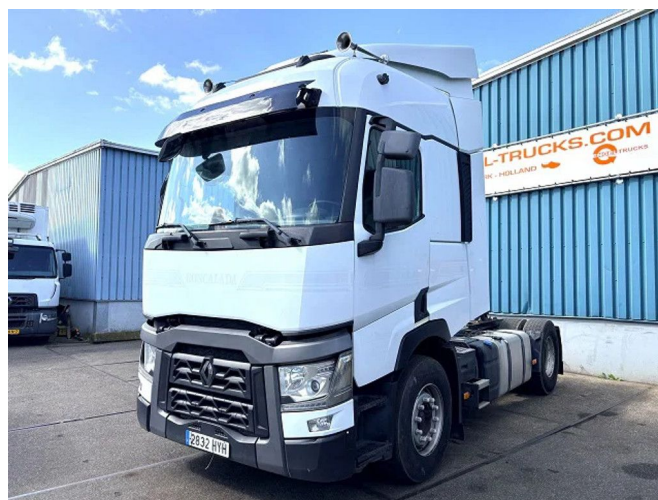
Renault T460 HIGH (EURO 6 / I-SHIFT / RETARDER / ... 4x2 Referentienummer: SN 60122226